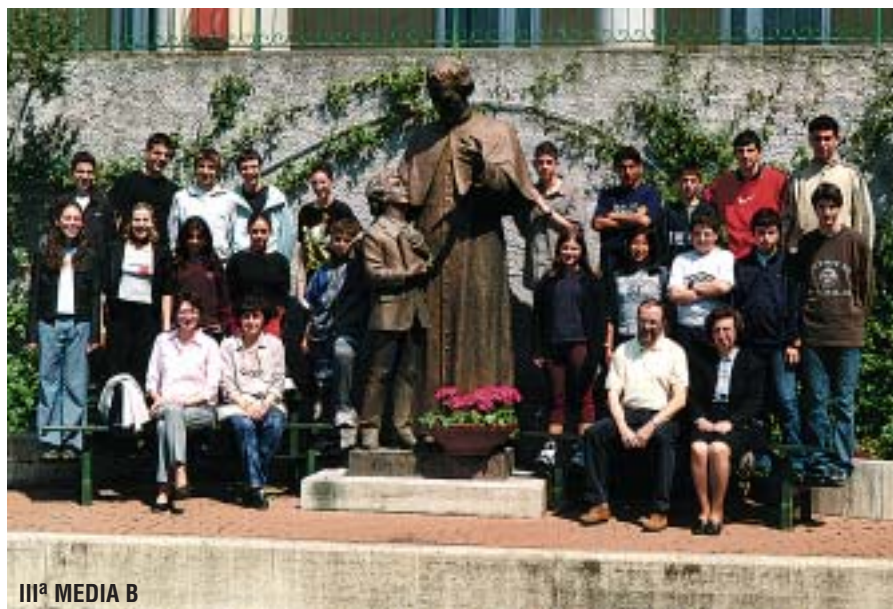
III a MEDIA B

Questo è interessante davvero perché la libertà dei soggetti possono cominciare a costruirsi in piccole scelte, appunto, in piccoli passi verso la dedizione, la vocazione, dentro questi luoghi; è come se fosse soprattutto dentro micro comunità di senso, piuttosto che dentro relazioni istituite, che si rielaborano orientamenti importanti per la vita. ■