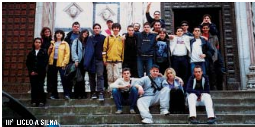
III a LICEO A SIENA

Ma l'aspetto più bello di questa breve ma intensa esperienza è stato, sicuramente, il cli-