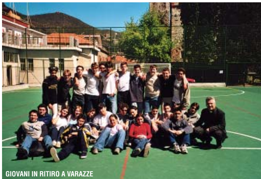
GIOVANI IN RITIRO A VARAZZE