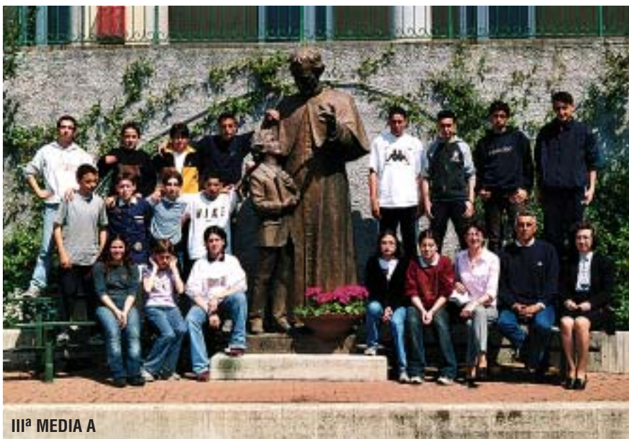
III a MEDIA A

L'incontro si è protratto fino alle 13 quando l'oratore si è congedato dalla comunità parrocchiale del Don Bosco di Sampierdarena lasciando dietro di sé l'eco delle sue parole, talora scomode, ma incoraggianti, mai banali, e la sua esperienza di testimone del Vangelo tra gli ultimi e gli emarginati, ma anche tra quelli che ha chiamato gli "inclusi" i giovani fortunati, quelli "perbene", che devono essere stimolati ad operare in modo concreto per diventare adulti veri, coerenti e credibili. ■