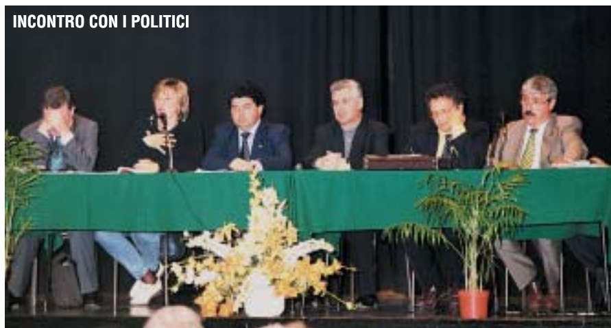
INCONTRO CON I POLITICI