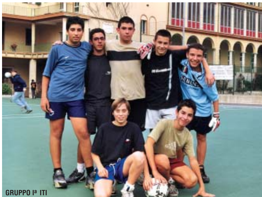
GRUPPO I a ITI

Ogni classe ha vissuto la sua serata di festa con pizze, giochi, musica per stare insieme in allegria. Erano presenti anche gli insegnanti... senza registro e con la voglia di sentirsi più giovani con i loro studenti. ■