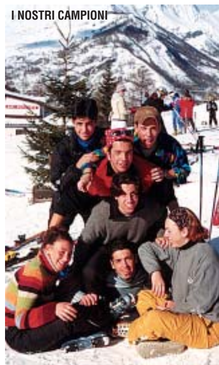
I NOSTRI CAMPIONI