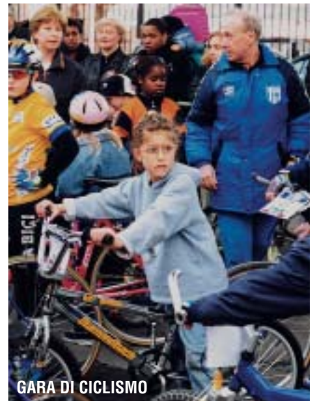
GARA DI CICLISMO

Da atleti non potevamo esprimere un giudizio completo sulle metodologie di allenamento,