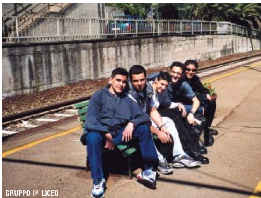
GRUPPO II a LICEO