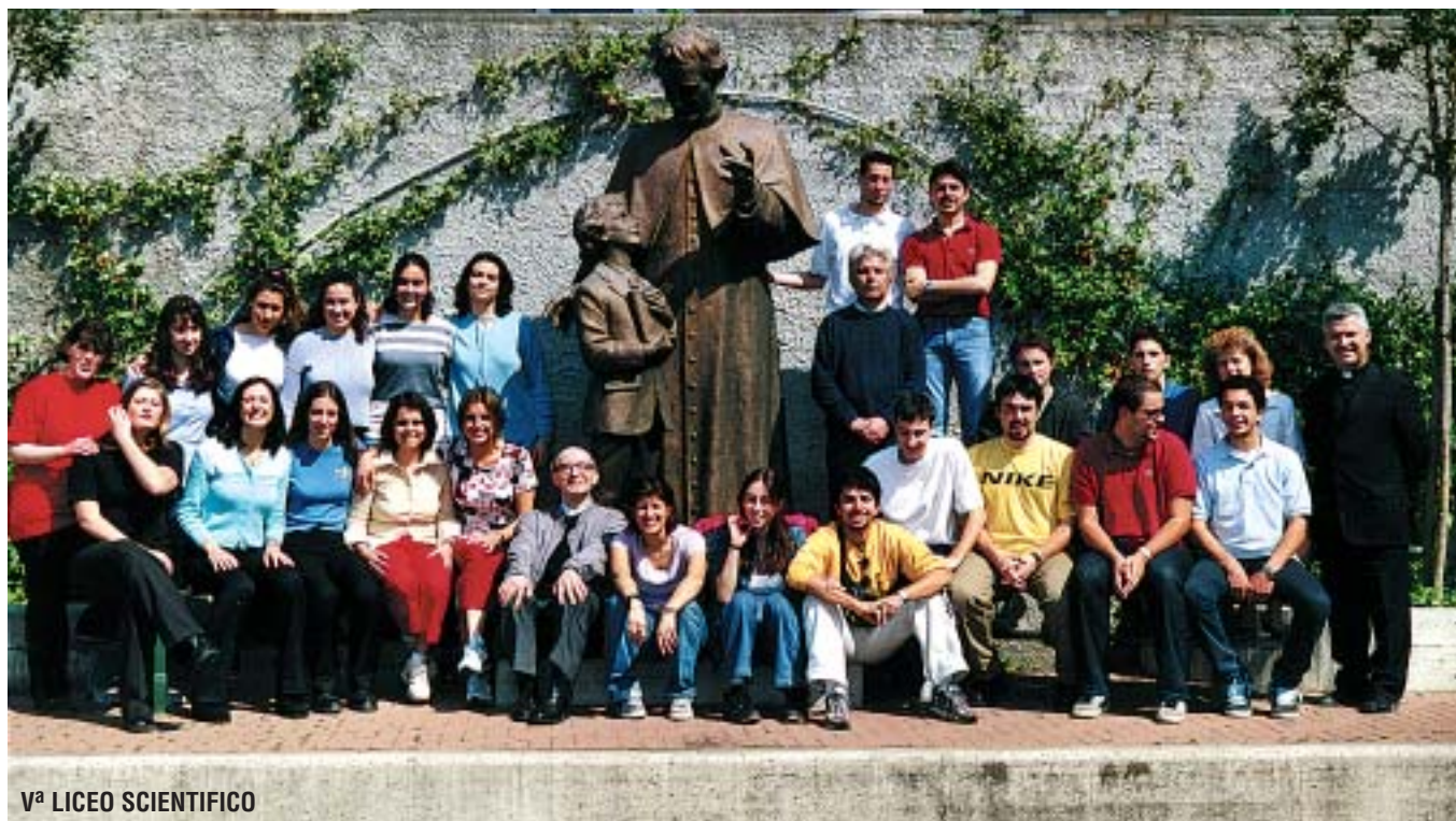
V a LICEO SCIENTIFICO

Il “Don Bosco duemila” naviga col suo carico di novità a vele spiegate nel nuovo millennio. Il Santo dei giovani aveva detto che Sampierdarena nel tempo avrebbe acquistato la stessa importanza di Torino-Valdocco ove il suo sogno cominciò a farsi realtà. Genova come Torino! Un sogno affidato nel tempo ai Salesiani e a quanti ne condividono lo spirito e la passione educativa che coinvolge la città.